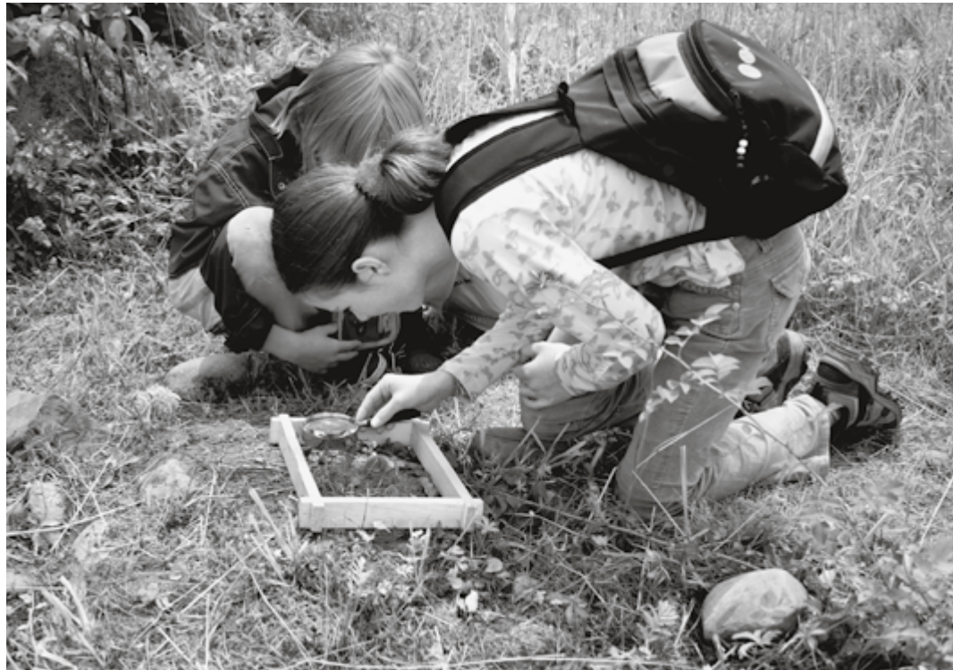
Forschendes Lernen zu Biodiversität. Kinder und Jugendliche üben Fähigkeiten und Fertigkeiten gezielt und «unmittelbar».

In der Broschüre für Lehrpersonen sind neben Grundlageninformationen konkrete Unterrichtsvorschläge zu finden. Diese Materialien stehen auf einer Mediendatenbank zur Verfügung. Dort werden aktuelle Projekte, Medien und Produkte sowie über zwanzig Organisationen und Anbieter geordnet nach Themen, Zugängen und Schulstufen vorgestellt. Die Mediendatenbank bietet Lehrpersonen Arbeitsmaterialien, die exemplarisch und stufengerecht verschiedene Aspekte der Bedeutung von Biodiversität darstellen. Der Zugang zur dieser digitalen Datensammlung erfolgt mittels der Internet-Nutzungslizenz, die in der Broschüre enthalten ist.