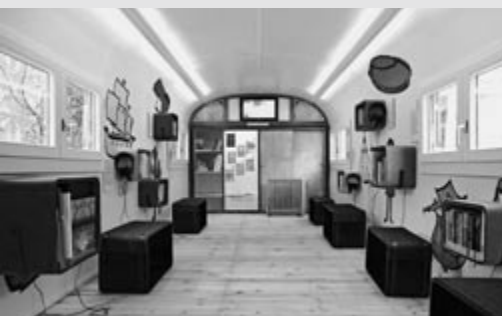
Die Zirkuswagenbibliothek lädt ein, Bücher aus vergangenen Jahrzehnten zu durchstöbern.

Der Zirkuswagen neben dem Jubiläumszelt lädt Schulklassen mit Workshops und Ausstellung zum Schmökern, Schreiben, Schauen und Hören rund um Kinder- und Jugendbücher ein.